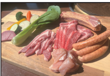
● 熱盛セット 4,500円 たくさん 食べたい方に！