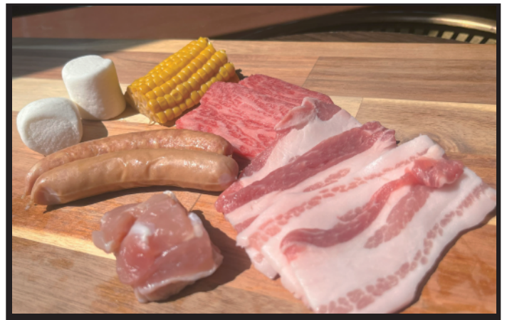
● キッズセット 2,700円 小学生のスタンダードメニュー