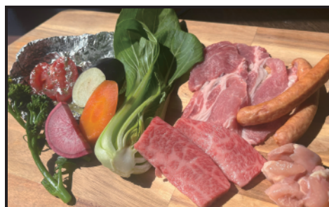
● プチエールセット 3,500円 野菜のホイル焼きと デザートつき！