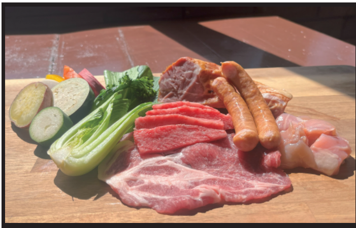
● コスパセット 3,500円 大人（中学生以上）のスタンダードメニュー